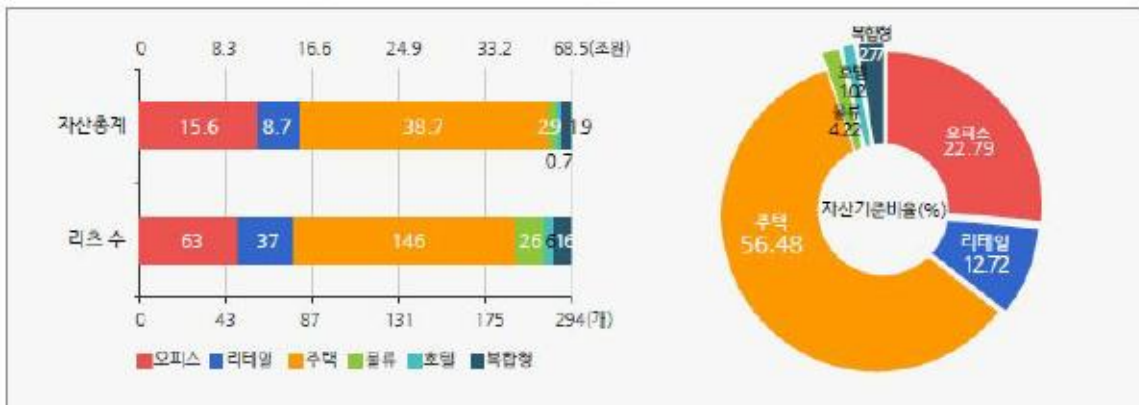
[운용부동산 유형별 리츠수 및 자산총계]