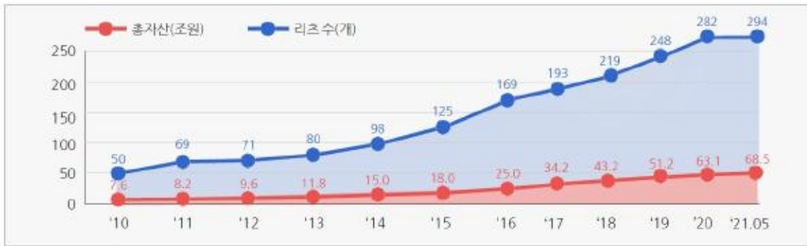
[리츠수 및 자산규모 변동추이]