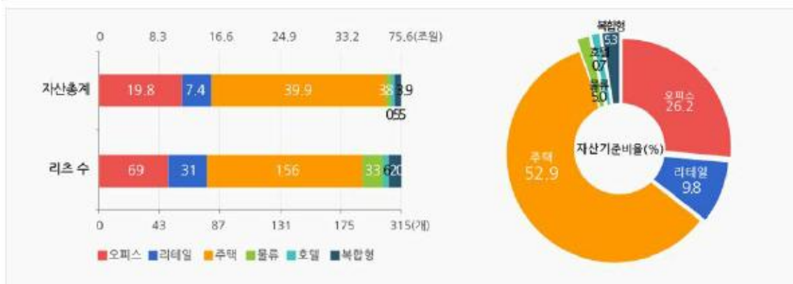
유형별 리츠수 및 자산통계