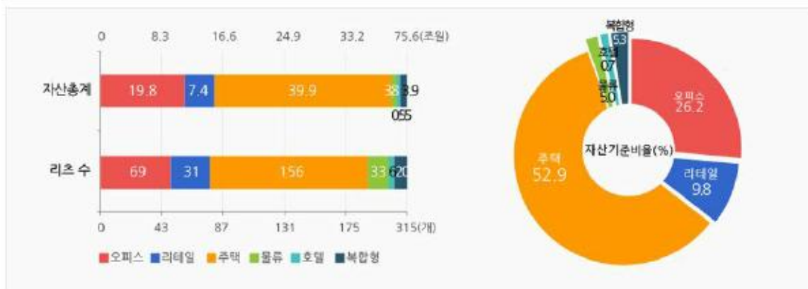
유형별 리츠수 및 자산통계