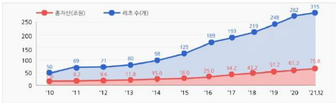
리츠수 및 자산규모 변동추이